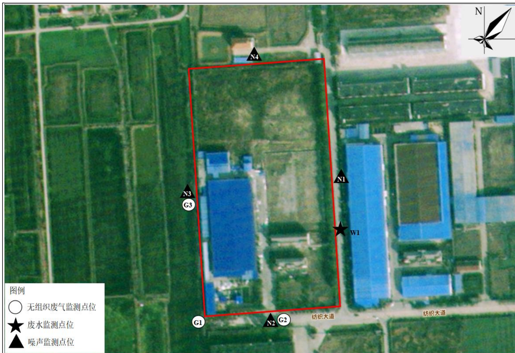
附图 4 项目验收监测点位图