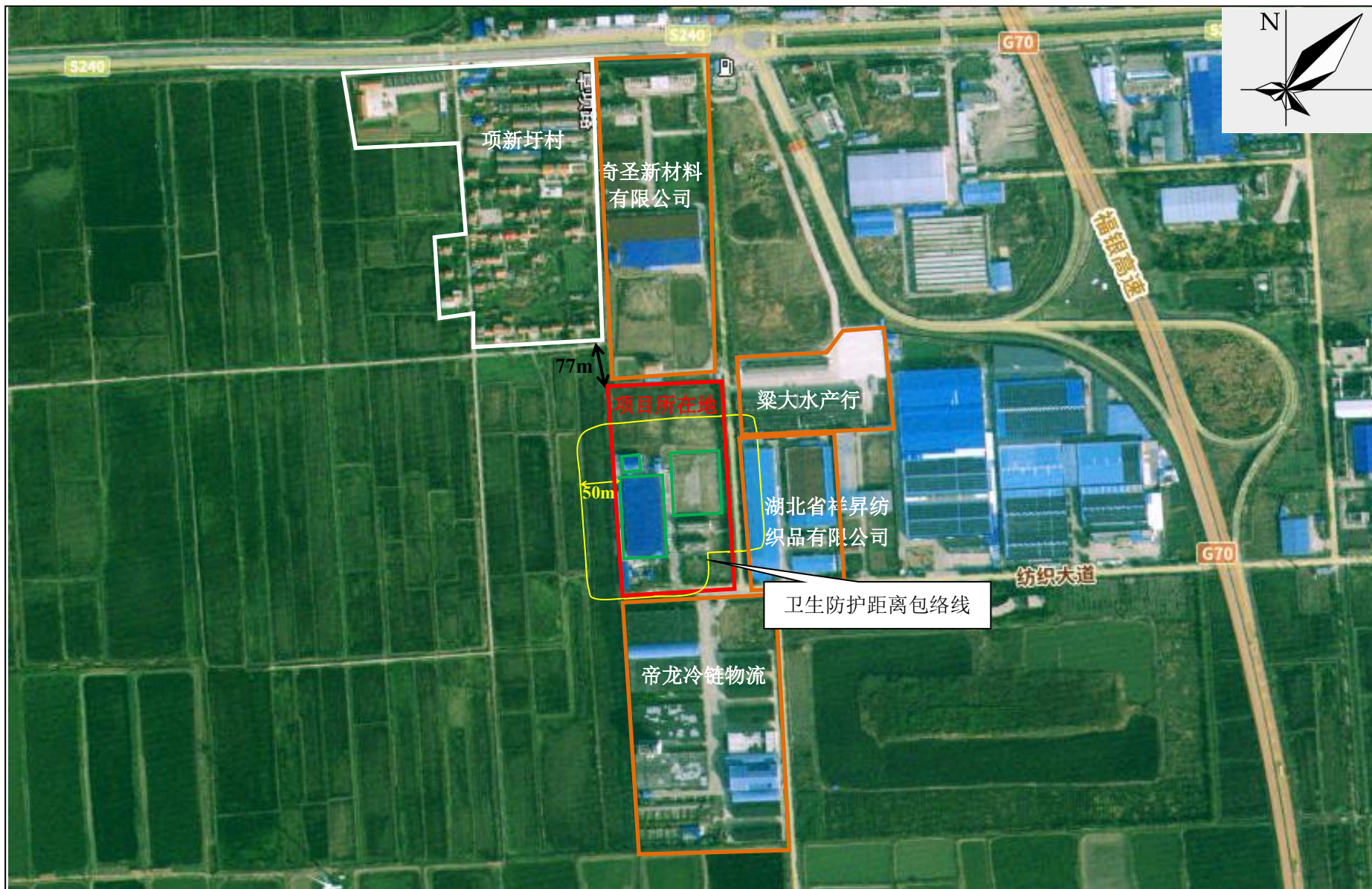
附图6 项目卫生防护距离包络线图