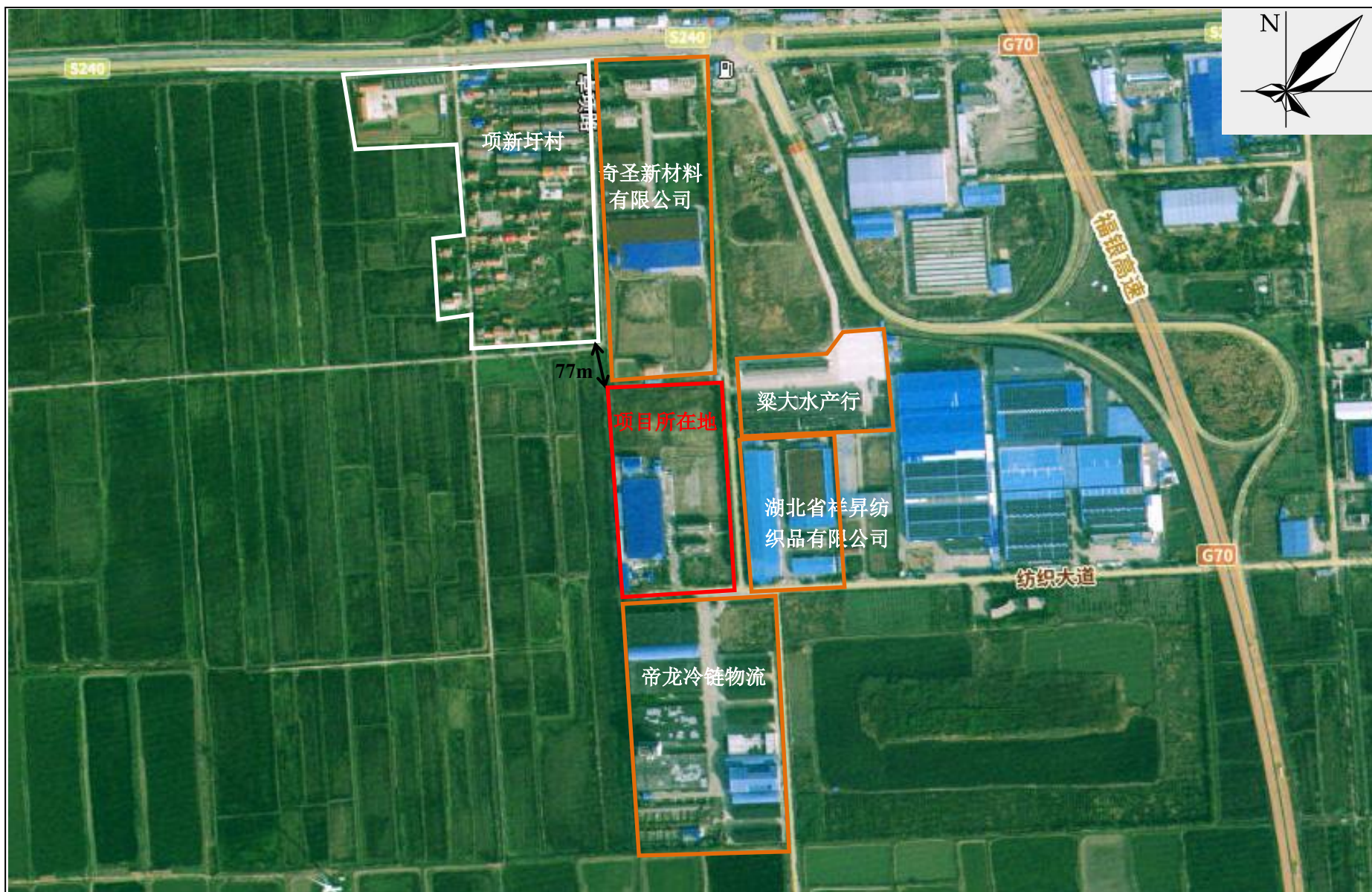
附图2 项目周边关系示意图