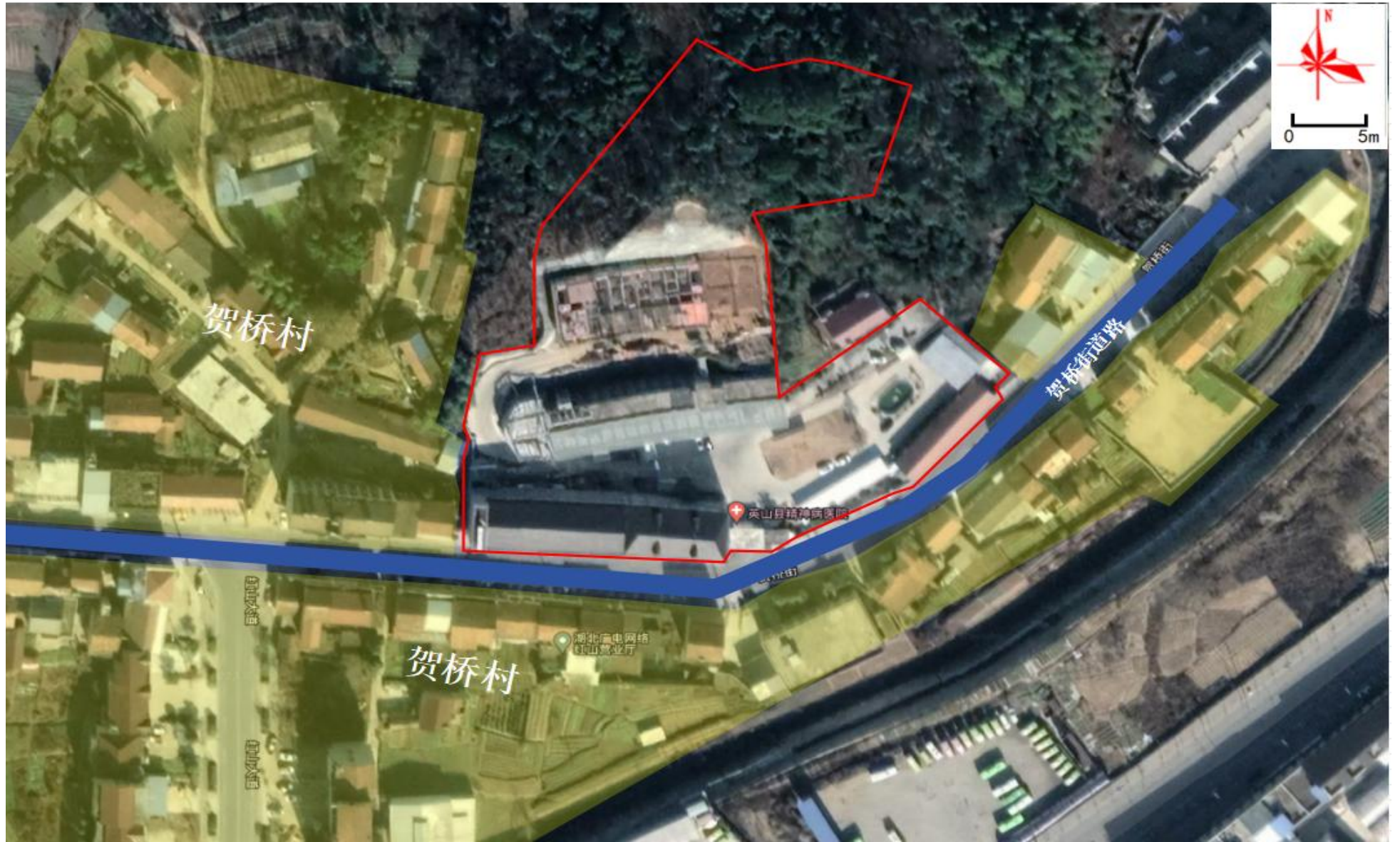
附图 2 项目周边环境关系示意图