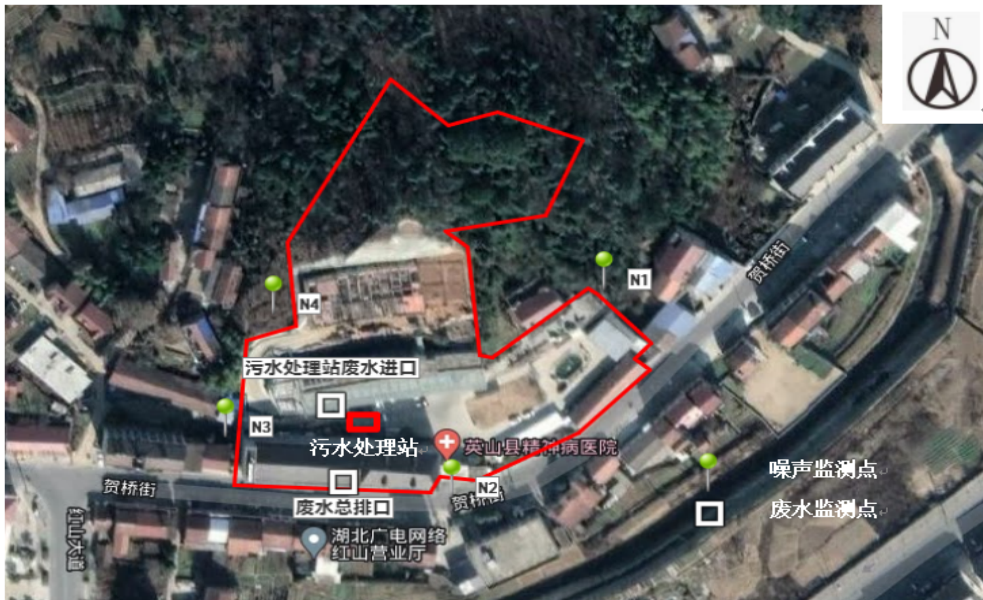
附图 3 项目验收监测点位图